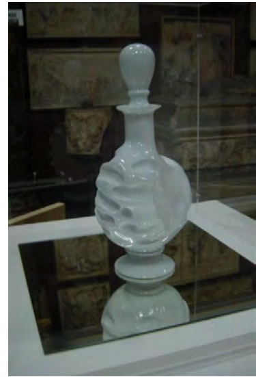
Eau de brume, 2006 © Pae White

Parmi les artistes exposés, Pae White , artiste de Los Angeles présente le fruit de sa collaboration en 2006 avec la Fondation d'Entreprise Bernardaud à Limoges pour aboutir à la réalisation d'un vase, prototype d'une œuvre unique, véritable sculpture. Créée afin de matérialiser un parfum, Pae White imagine un très beau flacon de porcelaine sur lequel elle intervient en apposant l'empreinte fine, douce et peu profonde d'une main de femme et celle, plus forte, grande et virile d'une main d'homme.