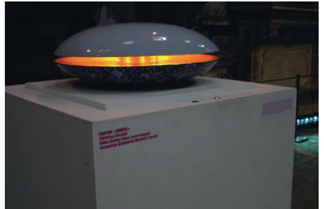
Lumière, 2006 ©Christian Biecher

Christian Biecher , a choisi de réaliser deux demi sphères à Faenza, en reprenant les motifs de la renaissance italienne de fleurs de lys en deux couleurs de bleu sur une des sphères, pour laisser l'autre sphère d'un blanc virginal à l'extérieur et entièrement recouverte de feuille d'or à l'intérieur pour matérialiser et diffuser l'idée même de la lumière.