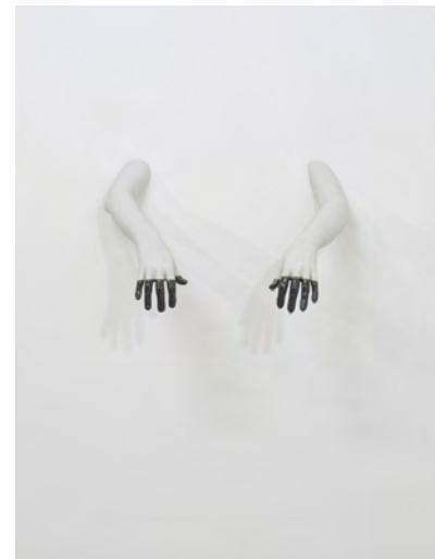
Sans titre 2010, porcelaine, émail

Emilie Satre fait la critique d'une société qu'elle considère "obsédée par l'image et de plus en plus virtuelle" en privilégiant des matériaux désuets, fragiles, et formés directement sur le corps. Son recours à la céramique, la porcelaine ou encore le papier dans ses gouaches et dessins, sont autant d'actes dérisoires de résistance. Elle le dit elle-même "ma démarche est le fruit d'une utopie, celle d'une échappée, d'une fuite dans un monde onirique".