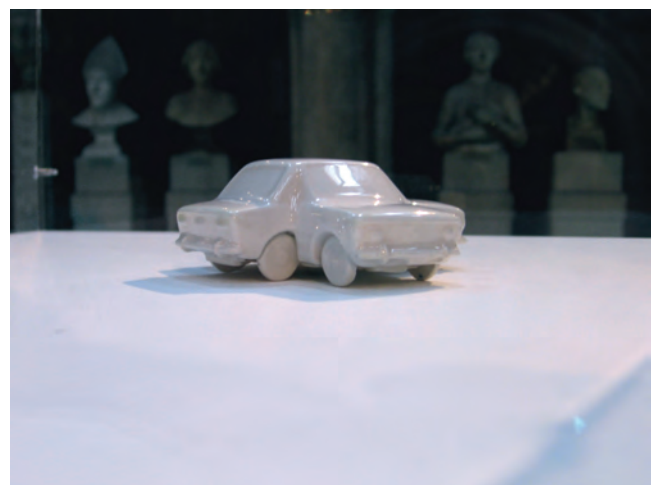
Voiture A9, 2006 © Leandro Erlich

Leandro Erlich , artiste argentin qui vit à Buenos Aires, conçoit deux petites voitures miniatures, réalisées en faïence et qui s'emboîtent l'une dans l'autre comme des reflets croisés, fidèle aux réflexions d'objets ou d'installation dans les miroirs chères à l'artiste, qui visent à questionner le visiteur sur le réel et le fictif.