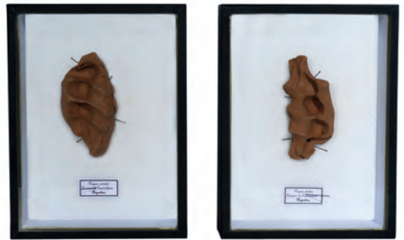
Poings d'argile © Julietta Hanono

Julietta Hanono expose une série de boîtes renfermant des poings d'argile, où la poigne de la main gauche et de la main droite en terre sont accrochées en vis à vis, déployées et disséquées comme deux ailes d'un papillon. Elle mêle ici le travail des entomologistes, dans un cabinet de curiosités où chaque jour est marqué par une empreinte de main, travail de l'homme sur la matière brute de l'argile, une façon de classifier la temporalité, le rythme de la vie de l'homme dans sa vie quotidienne.