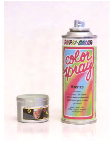
Nuit blanche, 2006 © Bertrand Lavier

Réalisé à la Manufacture de Faenza en Italie, et fidèle à son expression, l'artiste détourne une bombe de peinture, parfaite reproduction de la bombe qu'il utilise quotidiennement, mais en faïence émaillée.