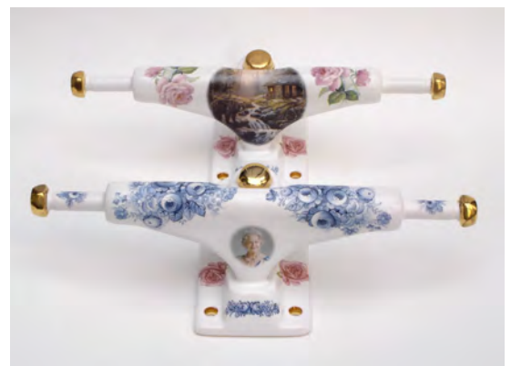
Queen Elizabeth 2010 Céramique et feuilles d'or, 19 x 7 x 7cm Edition de 6 + 2 EA ©Pier Stockholm - Courtesy Artifact'Paris

L'interprétation en céramique de Pier Stockholm trouve son origine à l'adolescence lorsque, fuyant sur son skateboard la commotion familiale, il ressentait ses « trucks » se briser sous lui. Cette sculpture, dont l'apparente solidité de la structure formée de deux parties distinctes contraste avec la fragilité du matériau et les motifs de fleurs, est une allégorie à l'amour, fondement d'un couple et du foyer familial.